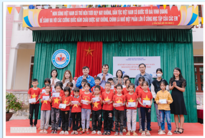
ĐIỂM TRƯỜNG HƯƠNG THỦY