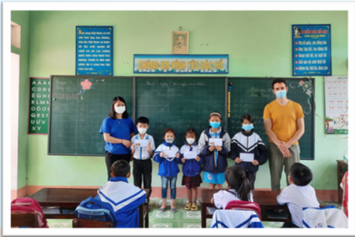
ĐIỂM TRƯỜNG BIÊN GIỚI PHÚ LÂM