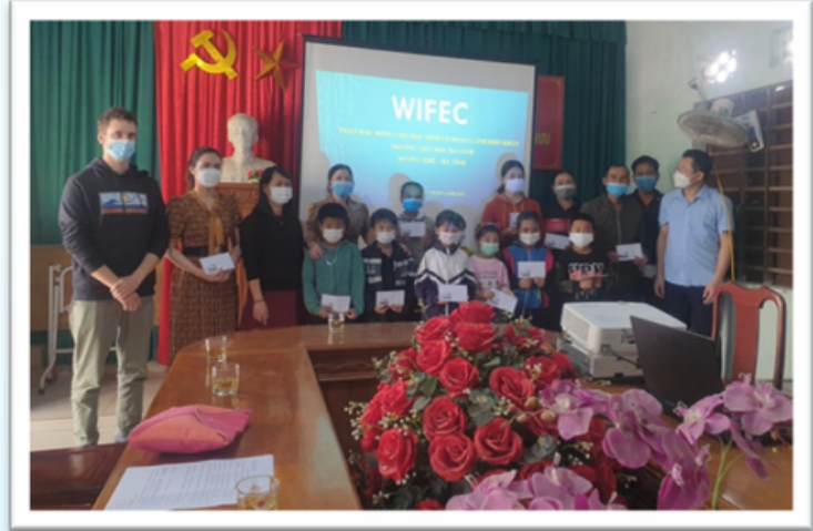
ĐIỂM TRƯỜNG HÀ LINH